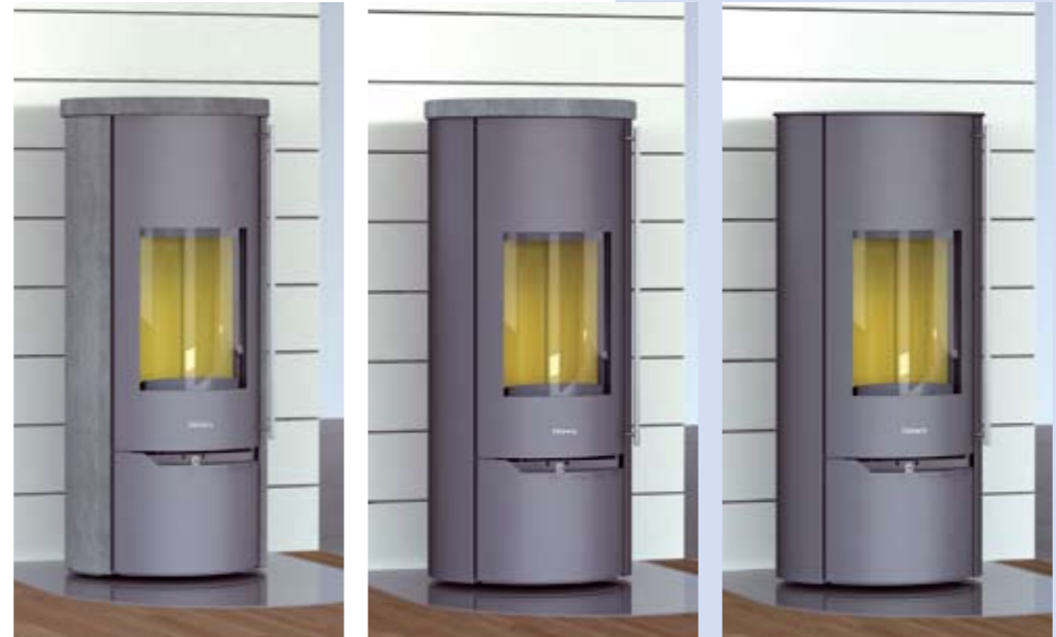
Tolima Aqua Compact avec habillage pierre ollaire Tolima Aqua Compact avec habillage acier et tablette pierre ollaire Tolima Aqua Compact avec habillage acier