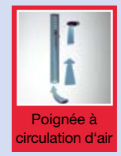
Poignée à circulation d'air